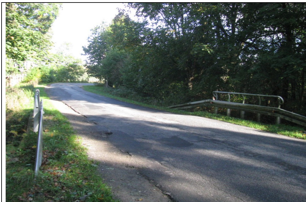
Fot. 2. Widok mostu od strony dojazdu – kierunek Wytowno (Rowy).