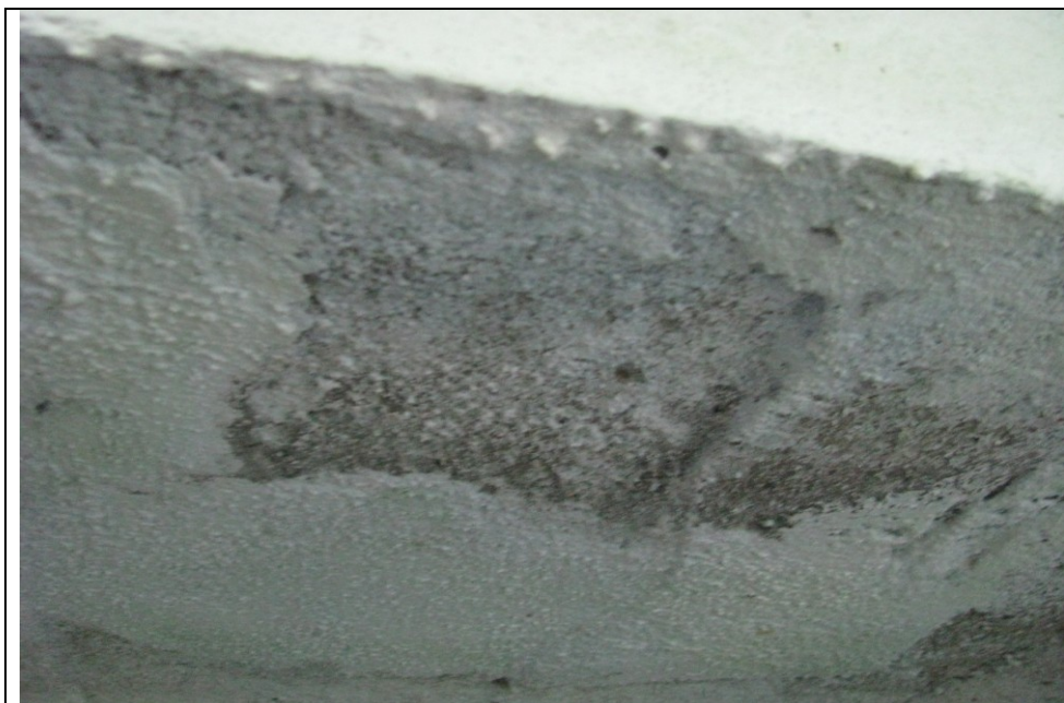
Fot. 5. Ubytki betonu na spodzie skrajnego pasma konstrukcji przęsła.