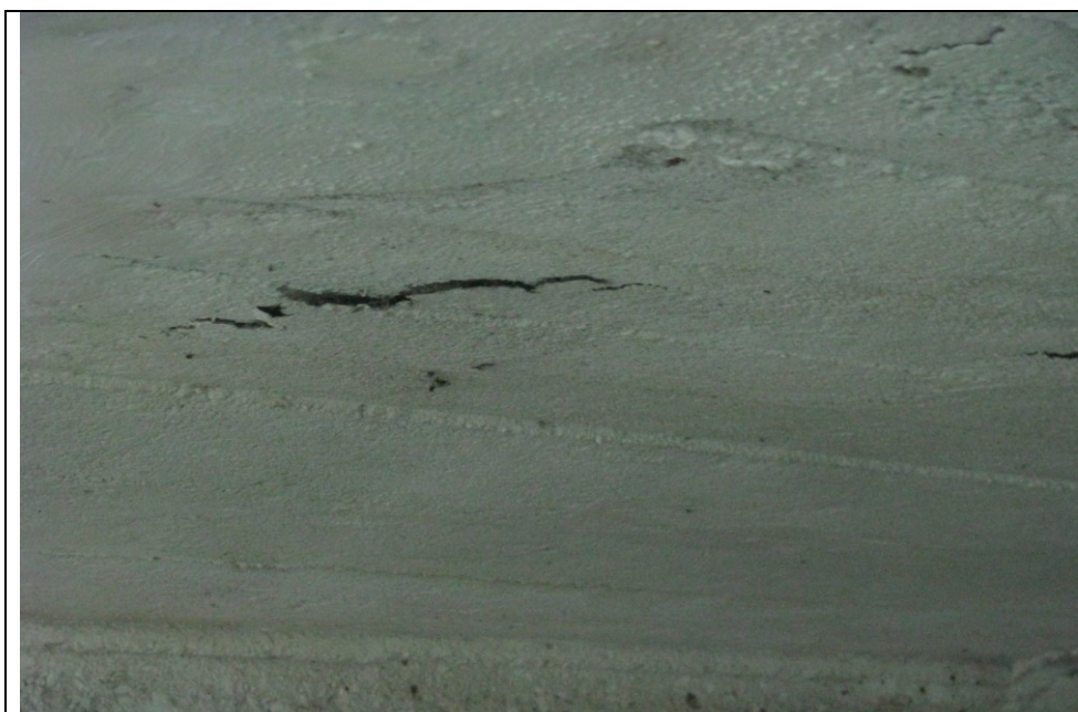
Fot. 6. Spękanie i odprysk otuliny zbrojenia na spodzie konstrukcji przęsła.