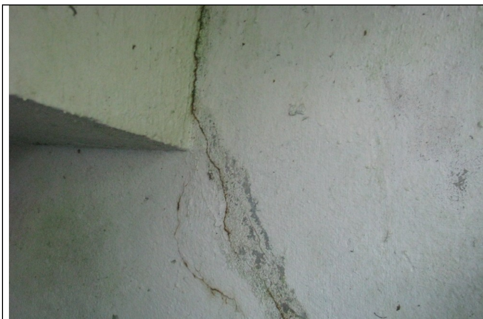
Fot. 4. Poziome spękanie betonu ścianki żwirowej przyczółka i konstrukcji przęsła w obrębie skosu przy podporze.