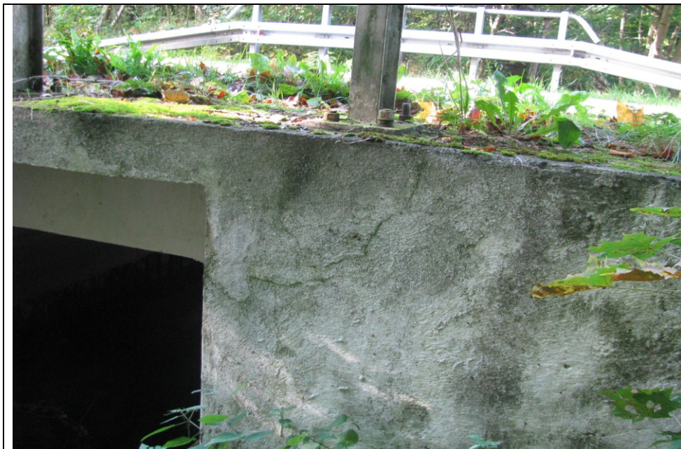
Fot. 3. Spękania betonu skrzydła przyczółka.