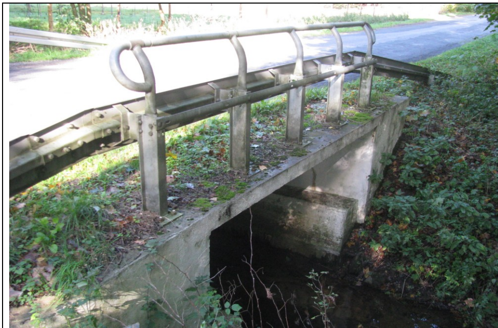
Fot. 1. Widok mostu z boku - od dolnej wody.